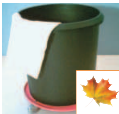
Support pour seau