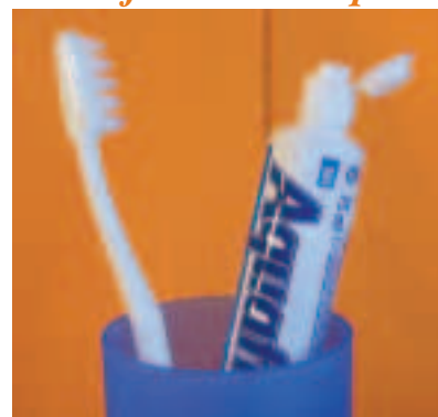
Dentifrice avec clapet