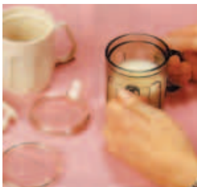
Tasse à deux anses