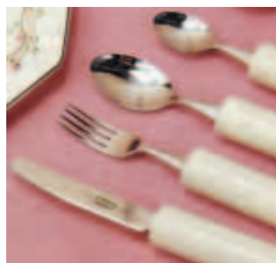
Couvert à large manche