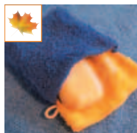
Le gant kangourou