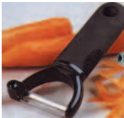
Éplucheur à large manche

Plus le manche de l'éplucheur de légumes, du couteau de cuisine, de la cuillère en bois est gros, plus il est facile à manipuler. Les poignées de casseroles peuvent être choisies larges et faciles d'utilisation.