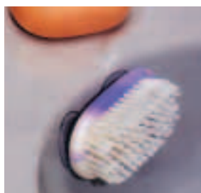
Dispositif sur ventouse