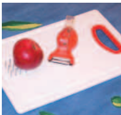
Planche de fixation

Pour maintenir les récipients, les aliments... utiliser par exemple un antidérapant, des ventouses ou différents systèmes bloquants.