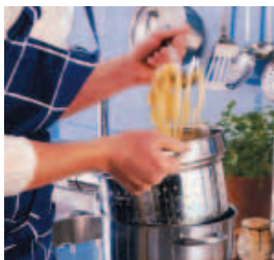
Panier de cuisson