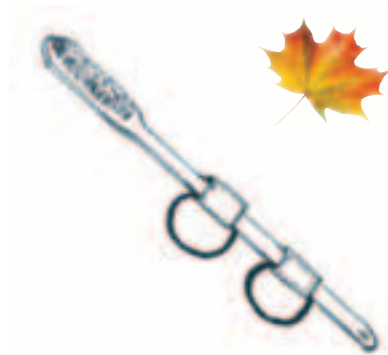
Brosse à dent à anneaux